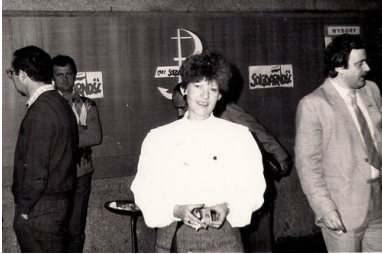
Spotkanie Komitetu Obywatelskiego „Solidarność” w Starachowicach.

parlamencie. Wokół takich założeń politycznych skupiła się duża grupa ludzi i to właśnie umożliwiło powstanie zorganizowanej struktury KPN-u w Kielcach.