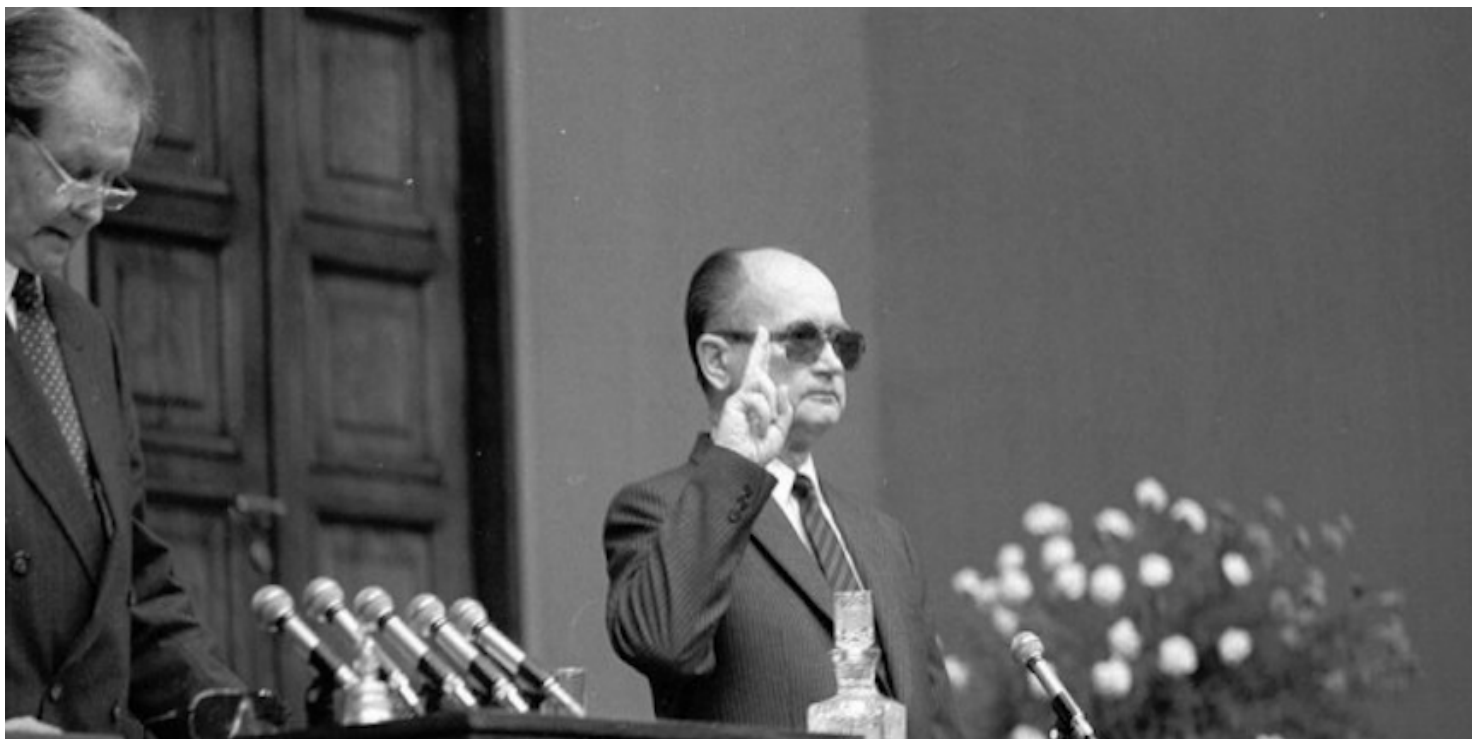
Ślubowanie Wojciecha Jaruzelskiego

https://przystanekhistoria.pl/pa2/tematy/transformacja-ustrojowa/88204,Veto-i-ZOMO.html