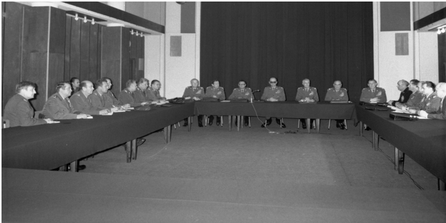
Posiedzenie Wojskowej Rady Ocalenia Narodowego pod przewodnictwem Wojciecha Jaruzelskiego; Warszawa, 14 grudnia 1981 r.

https://przystanekhistoria.pl/pa2/tematy/uklad-warszawski/76688,Niespelnione-prosby-towarzysza-Jaruzelskiego.html