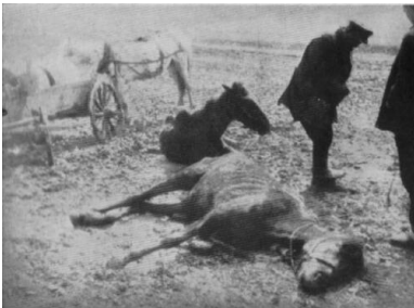
Wielki Głód na Ukrainie (okolice Charkowa, 1933 r.)