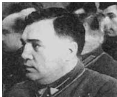
Michaił Frinowski (1900-1940)

16 lipca 1937 r. pojawił się podpisany przez zastępcę Jeżowa, Michaiła Frinowskiego, cyrkularz nr 51 o konfiskowaniu książeczek pracowniczych osobom, które przed uwięzieniem pobierały świadczenie emerytalne. Chodziło o to, że więźniowie emeryci lub ci, którzy pobierali emerytury za wysługę lat, przekazywali upoważnienia lub oddawali swoje książeczki rodzinom. Zatem bliscy takich więźniów przez jakiś czas mogli dostawać indywidualne czy akademickie emerytury. Od lipca 1937 r. naczelnicy organów NKWD osobiście odpowiadali za konfiskatę książeczek podczas aresztowania.