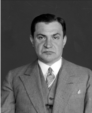
Bronisław Pieracki, minister spraw wewnętrznych.