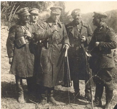
Oficerowie 3. Żelaznej Dywizji Strzelców Armii Czynnej URL na stanowisku w pobliżu Dniestru, 1920 r.; w środku dowódca dywizji, płk Ołeksandr Udowyczenko

Ściągnąwszy pod koniec maja 1920 r. do walki przeciwko połączonym wojskom polsko-ukraińskim znaczne siły, bolszewicy przeszli na początku następnego miesiąca do ofensywy i na dłuższy czas przejęli inicjatywę na froncie. Jako taran posłużyło silne zgrupowanie kawaleryjskie – 1. Armia Konna Siemiona Budionnego i 8. Dywizja Kawalerii Czerwonych Kozaków Witalija Primakowa. 12 czerwca bolszewicy zajęli Kijów, w połowie lipca doszli do linii Zbrucza, 25 lipca zajęli Brody, a dzień później – Tarnopol. Ukraińcy wyszli za Dniestr, Polacy wycofali się do Lwowa. Podczas ciężkich walk latem 1920 r., cofając się pod naporem wroga, armia gen. Omelanowycza-Pawłenki (do której na początku lipca dołączyła 3. Żelazna Dywizja Strzelców Udowyczenki) twardo utrzymywała obronę na swoim odcinku frontu, czym skutecznie zabezpieczała południowe skrzydło całego polskiego zgrupowania na Ukrainie. W tym czasie na Polesiu w oddzieleniu od głównych sił znajdowała się 6. Siczowa Dywizja Strzelców płk. Bezruczki. Szczególnie odznaczyła się ona na początku lipca w walkach o wieś Perga, za co otrzymała podziękowanie od polskiego Naczelnego Dowództwa.