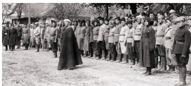
Symon Petlura (z lewej) dokonuje przeglądu oddziału Armii Czynnej URL, przed frontem oddziału gen. Iwan Omelanowycz-Pawłenko, Kijów, maj 1920 r.

Jednocześnie w Kamieńcu Podolskim, zajętym przez polskie wojska, rozpoczęto formowanie 4. Brygady Strzelców, a na terenie „niczyich” powiatów mohylowskiego i jampolskiego – Samodzielnej Brygady Strzelców. Jednostki te 20 marca połączono w 2. Dywizję Strzelców pod dowództwem płk. Ołeksandra Udowyczenki. Także w tym przypadku Polacy wzięli na siebie zapewnienie potrzebnego sprzętu wojskowego.