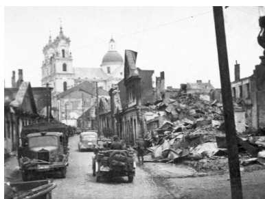
Fragment zniszczonego Grodna. Na pierwszym planie widoczne samochody wojskowe. Na drugim kościół pojezuicki pod wezwaniami św. Franciszka Ksawerego, 1941 r. Fot. NAC

Językiem urzędowym na Ukrainie został, oprócz rosyjskiego, ukraiński i jidysz; na Białorusi – białoruski i jidysz. Depolonizacji poddano też nazwy placów i ulic. Rozpoczęła się sowietyzacja i ukrainizacja szkolnictwa, przede wszystkim podstawowego. Do tego nacjonalizacji poddano zakłady pracy zatrudniające więcej niż 40 pracowników (choć nacjonalizacją objęto też mniejsze przedsiębiorstwa) oraz banki. Prowadzono akcję „uspółdzielczania” rzemiosła. Natomiast w grudniu 1939 r. większości właścicielom odebrano ich domy.