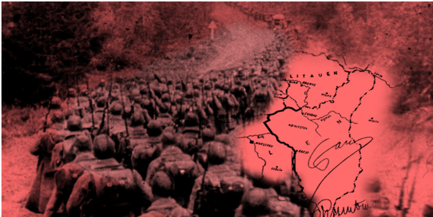
Kolumny piechoty sowieckiej wkraczające do Polski 17 września 1939 r.

https://przystanekhistoria.pl/pa2/tematy/ukraina/86332,Sowiecki-zabor-II-RP-czyli-wyzwolenie-Bialorusinow-i-Ukraincow.html