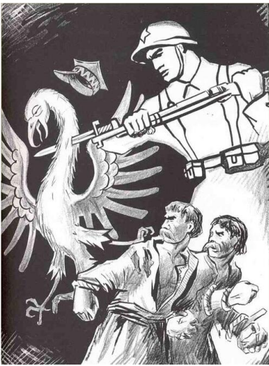
Sowiecki antypolski plakat propagandowy z 1939 r. (domena publiczna)