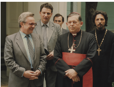
Spotkanie kard. Józefa Glempa z

W trakcie rozmowy Jaruzelski zwrócił uwagę arcybiskupa na procesy rozgrywające się w Związku Sowieckim. Jak mówił, dzieją się tam rzeczy wielkie i powinny zostać zauważone przez Kościół, gdyż będzie to miało wpływ na przyszłość świata. W tym kontekście zwrócił uwagę na wywiad prymasa. Jak podkreślił, do rozmowy doszło za zgodą czynników państwowych obu krajów. Silvestrini nie podzielał tego optymizmu. Mówił, że relacje sowiecko-watykańskie są na razie w fazie wstępnej; użył nawet sformułowania, że znajdują się w przedpokojach. Moskwa nie odpowiedziała na pozytywne gesty papieża, m.in. wysłanie przedstawiciela na rozmowy o zmianach w prawie wyznaniowym. Nierozwiązane – tłumaczy dalej arcybiskup – są problemy Kościoła na Litwie i Białorusi, w ogóle nie udało się poruszyć legalizacji Kościoła greckokatolickiego, a bez tego wszelkie deklaracje będą bez pokrycia. Dodał jednak, że Watykan z uwagą obserwuje reformy Gorbaczowa i ma nadzieję, że doprowadzą one do rzeczywistej zmiany w położeniu ludzi wierzących 5 .