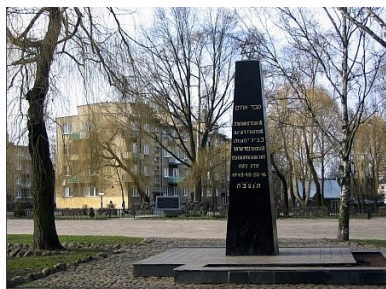
Pomnik Bohaterów Getta. Cmentarz żydowski w Białymstoku

Trzy spośród swoich wypraw Niemiec odbył do Wołkowyska, gdzie na przełomie 1942 i 1943 r. funkcjonował jeden z obozów zbiorczych, z którego sukcesywnie Żydów wywożono do Trebinki. Aby wydostać odpowiednie osoby żydowscy lekarze najpierw aplikowali zastrzyk, po którym następowała utrata przytomności. Wówczas to – jako „nieboszczycy” – byli oni przewożeni na cmentarz. Tam odzyskiwali przytomność, przebierali się w chłopskie ubranie i wsiadali do samochodu.