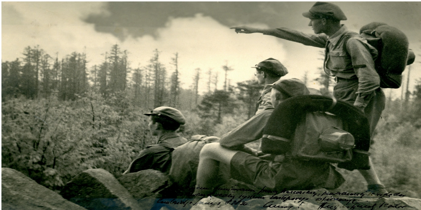
Polscy harcerze w Stanach Zjednoczonych podczas jednego z obozów, 1936 r.

https://przystanekhistoria.pl/pa2/tematy/usa/106294,Harcerstwo-w-ramach-Sokolstwa-Polskiego-w-Ameryce.html