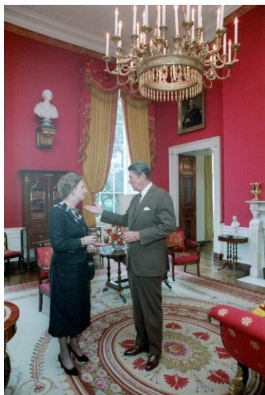
Pokój Czerwony Białego Domu, 1983. Prezydent USA Ronald Reagan rozmawia z premier

Druga wygrana Ronalda Reagana w wyborach prezydenckich w USA, która nastąpiła w listopadzie 1984 r., była bardziej efektowna niż pierwsza. Sukcesy na polu gospodarczym i międzynarodowym, a także sympatia obywateli, widoczna zwłaszcza po zamachu na jego życie z marca 1981 r., sprawiły, że mimo podeszłego wieku zdobył blisko 60 proc. głosów i zwyciężył swego konkurenta, Waltera Mondale’a, aż w 49 z 50 stanów.