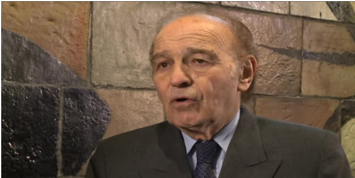
Samuel Pissar - światowa kariera chłopca z Białegostoku

https://przystanekhistoria.pl/pa2/tematy/usa/81407,Samuel-Pisar-swiatowa-kariera-chlopca-z-Bialelegostoku.html