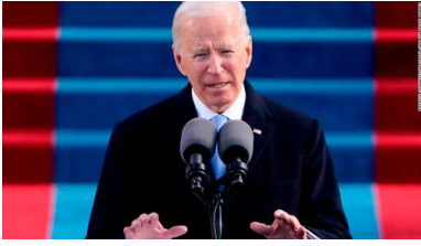
Joseph R. Biden - 46. prezydent