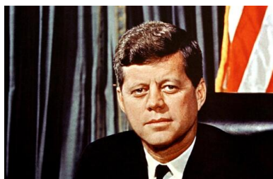
John F. Kennedy - 35. prezydent