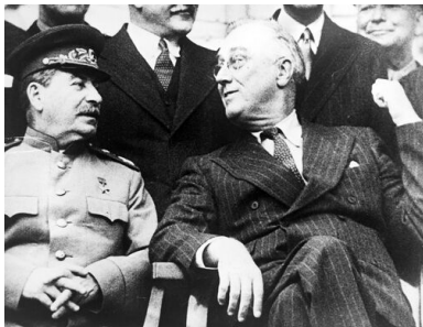
Józef Stalin i Franklin Delano Roosevelt na konferencji w Teheranie, listopad 1943 r.

Stalin, znając zamiary swoich partnerów, umiejętnie podsycił spory między Churchillem a Rooseveltem. Poważnie negocjując, kpł sobie wielokrotnie w sposób dyskretny z brytyjskiego premiera, schlebując przy tym na każdym kroku amerykańskiemu prezydentowi. Do tego stopnia zaskarbił sobie sympatię Roosevelta, że w prywatnych rozmowach po konferencji przywódca USA nazywał go „wujkiem Joe”.