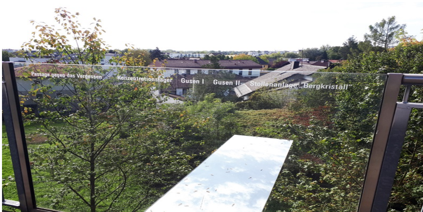
Instalacja upamiętniająca ofiary obozu Gusen, St. Georgen, Górna Austria 2018 r. Wyjazd Pamięci zorganizowany do KL Mauthausen-Gusen przez IPN w Poznaniu oraz Stowarzyszenie Rodzin Polskich Ofiar Obozów Koncentracyjnych.

https://przystanekhistoria.pl/pa2/tematy/usa/91505,Wyzwolenie-KL-Gusen-I-i-II-przez-wojska-amerykanske-5-maja-1945-r.html