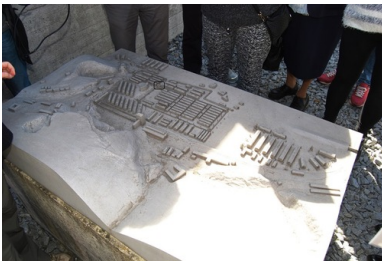
Makieta Gusen I i Gusen II ustawiona przed Memorial Gusen.

KL Gusen I i jego filia Gusen II zostały podobnie jak KL Mauthausen wyzwolone najpóźniej ze wszystkich obozów. Głównym powodem tego był fakt, że rejon ten znalazł się na styku dwóch wielkich ofensyw, radzieckiej napierającej ze wschodu i alianckiej z zachodu. Mimo zbliżających się frontów, życie obozowe w Gusen biegło swoim zbrodniczym rytmem, a tysiące więźniów pracowało nadal w halach produkcyjnych takich firm jak austriacki koncern Steyr-Daimler-Puch AG oraz niemiecki Messerschmitt AG. W 1945 r. średnia życia przeciętnego więźnia w Gusen wynosiła zaledwie trzy miesiące! To tyle, ile założyli sobie, tworząc ten obóz, nazistowscy zbrodniarze. Głównym powodem tak wysokiej śmiertelności w tym okresie, były drastyczne braki w zaopatrzeniu w żywność, co wywołało w obozie ogromny głód i to na kilkanaście dni przed wyzwoleniem. Była to sytuacja, która zagroziła egzystencji trzymających się resztek nadziei tysięcy więźniów, a wkrótce okazało się, że nie byli oni jedynymi, których należało wówczas nakarmić.