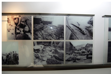
Fragment wystawy stałej w Memorial Gusen. Na wystawie widoczne są zdjęcia z wyzwolenia obozu. Zostały zrobione przez żołnierzy amerykańskich.

wojny. Sytuacja przedstawiona przez Zieryisa miała rzeczywiście miejsce, ale brak jego zgody na wysadzenie sztolni, wcale nie musi być prawdą. Jak sam wspominał w innym miejscu, miał wysadzić sztolnie tylko w momencie zbliżania się Armii Czerwonej. W przypadku zbliżania się wojsk amerykańskich nakazano odstąpić od tego zamiaru, a taka sytuacja miała właśnie miejsce na początku maja 1945 r.