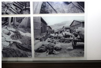
Fragment wystawy stałej w Memorial Gusen. Na wystawie widoczne są zdjęcia z wyzwolenia obozu. Zostały zrobione przez żołnierzy amerykańskich.

Począwszy od 1943 r. sytuacja w obozie Gusen I uległa zmianie. W związku z klęskami wojsk III Rzeszy zmieniono profil tamtejszej produkcji z kamieniarskiej na zbrojeniową. W tym celu postanowiono wybudować niedaleko Gusen system sztolni, który oznaczono kryptonimem „Kellerbau”. Budowali go sami więźniowie,