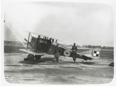
Ansaldo A.1 Balilla o numerze bocznym 10 (nr fabryczny 16739, nr CWL 16.4). W 7. Eskadrze Myśliwskiej od maja 1920 roku.

14 października Amerykanie zjawili się u Józefa Piłsudskiego. Zostali przyjęci dość chłodno. Naczelnik Państwa przyrównał swych gości do najemników. Nie sprzeciwił się jednak ich służbie, wygłaszając słynną frazę Pokażcie co umiecie!