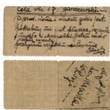
42. 43. Grupy więźniary Stawomka katyńskiego. Zbiory Stowarzyszenia Katyń w Szczecinie.