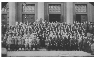
Grupa ochotników z Chicago do Armii Polskiej we Francji, 1917 r.

Próby doprowadzenia do porozumienia pomiędzy tymi organizacjami podjęli w sierpniu i wrześniu działacze „Sokoła”, ale nie przyniosły one rezultatu. W samym zresztą „Sokole”, traktującym powstały w Galicji Naczelny Komitet Narodowy jako „jawny rząd polski”, nasiliły się objawy zniecierpliwienia, przejawiające się w pomysłach tworzenia złożonej z Polaków siły zbrojnej u boku Francji czy Anglii i to bez uprzedniego uzyskania jakichkolwiek gwarancji politycznych.