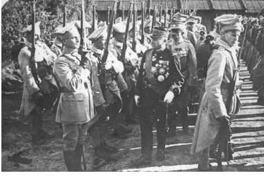
Wizyta szefa francusko-polskiej misji wojskowej generała Louisa Archinarda w ośrodku wyszkolenia Armii Polskiej we Francji w Sille-le Guillaume, 1917 r.

Polityczne zwierzchnictwo nad tą formacją, choć dopiero od 20 marca 1918 r., objął kierowany przez Dmowskiego Komitet Narodowy Polski. Wypełnienie szeregów armii polskiej we Francji nie byłoby możliwe w przypadku automatycznego przeniesienia do niej Polaków służących w armii francuskiej, było ich bowiem zaledwie około 2 tysięcy.