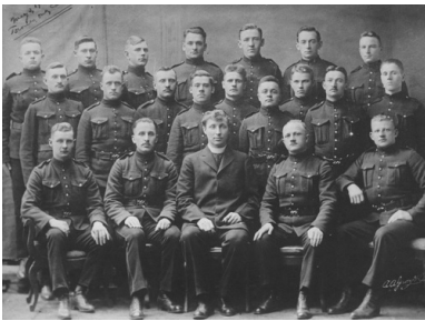
Grupa polskich uczniów i absolwentów szkoły oficerskiej w Toronto. Pierwsi oficerowie polscy z grupy tzw. "Straceńców", 1917 r.

Skonkretyzowanie, i to na szeroką skalę, przygotowań Polonii do czynnego zaangażowania się w wojnę europejską po stronie walczącej z państwami centralnymi następowało w momencie istotnych przemian w polityce Stanów Zjednoczonych.