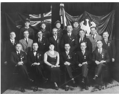
Uroczystość w Toronto z okazji