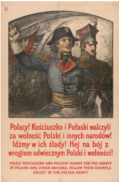
Plakat werbunkowy do Armii Polskiej (autorstwa Władysława Bendy) ze zbiorów Muzeum Niepodległości w Warszawie