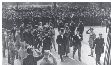
Przedstawiciele polskiej misji wojskowej przed ratuszem w Nowym Jorku. Widoczny m.in. Ignacy Jan Paderewski. Porucznik Józef Sierociński stoi czwarty od lewej, marzec 1918 r.

Nie ukrywał jednak, iż polityczne stanowisko komitetu galicyjskiego, za którym opowiadał się na gruncie amerykańskim KON, ma charakter proniemiecki, więc nie należy go wspierać. W rezultacie osoba Paderewskiego stała się przedmiotem ataków ze strony prasy związanej z KON, co przy znacznej popularności artysty wśród Polonii prowadziło do niezbyt przychylnych reakcji wobec tej organizacji.