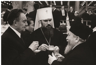
Od lewej: Władimir Kurojedow i metropolita Aleksy II (Ridigier).