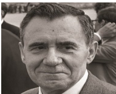
Andriej Gromyko, 1972 r.