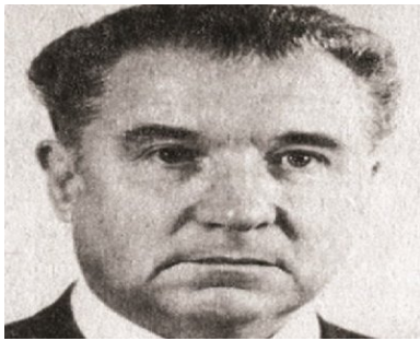
Anatolij Kiriejew. Fot. Wikimedia Commons