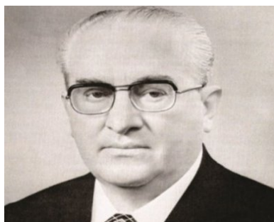
Jurij Andropow, 1983 r.