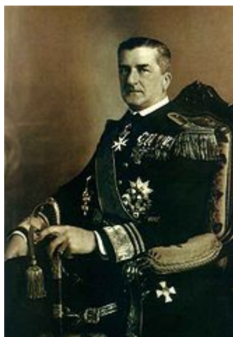
Miklós Horthy (1868 -1957) - węgierski polityk i wojskowy, regent Królestwa Węgier w latach 1920-1944