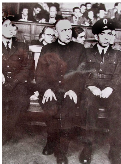
Podczas procesu w 1949 r.

W stolicy prymas starał się porządkować sprawy kościelne. Rząd Imre Nagya zobowiązał się naprawić krzywdy wyrządzone Kościołowi w czasach terroru Rákosiego. Przywrócona miała zostać suwerenność władzy biskupów, zwalniano z więzień księży, wkrótce miano przeprowadzić ich rehabilitację. Wieczorem 3 listopada prymas wygłosił radiowe orędzie do narodu. Wzywał do zaniechania samosądów i terroru wobec przeciwników politycznych. Rządowi Imre Nagya udzielał warunkowego wsparcia. Domagał się przywrócenia wolności Kościołowi. Wyraził również oczekiwanie, że z Węgier zostaną wycofane wojska sowieckie i przeprowadzone zostaną wolne wybory pod międzynarodową kontrolą. Po nagraniu wrócił do rezydencji w Budzie, ale w nocy został wezwany do parlamentu. Przebywali tam już członkowie rządu. Napięcie było ogromne, lada chwila spodziewano się szturmów sowieckich czołgów. Kiedy atak się zaczął, minister Zoltán Tildy poradził prymasowi, aby szukał ratunku na własną rękę, gdyż wszystko jest stracone. O świcie Mindszenty schronił się w amerykańskiej ambasadzie przy pl. Wolności. 8