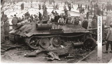
Uszkodzony czołg sowiecki w Budapeszcie, październik 1956 r.