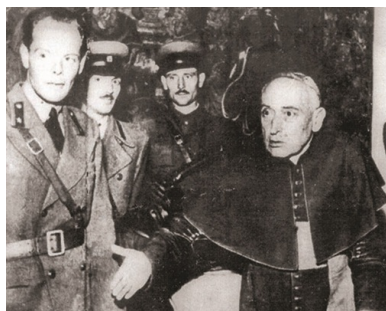
Kard. József Mindszenty po uwolnieniu w 1956 r.

Później okazało się, że w trakcie poufnych negocjacji dyplomaci watykańscy obiecali rządowi węgierskiemu, że prymas nie będzie się wypowiadał publicznie i nie opublikuje swoich pamiętników. Mindszenty nic o tym nie wiedział, więc nie czuł się zobowiązany do przestrzegania owych ustaleń. Jeździł po świecie świadcząc o zniewoleniu Kościoła na Węgrzech, opublikował także pamiętniki. W Rzymie nie czuł się dobrze i po kilku miesiącach wyjechał do Wiednia. Zamieszkał w węgierskim kolegium Pázmáneum.