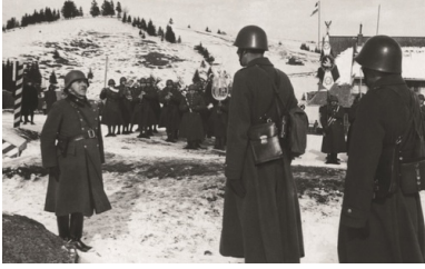
Składanie raportu podczas uroczystości powitania węgierskich oddziałów wojskowych na granicy polsko-węgierskiej po zajęciu przez Węgry Rusi Zakarpackiej, marzec 1939 r.

18 października 1938 r. Beck zaliczył osiągnięcie granicy z Węgrami „w rejonie Rusi Zakarpackiej” do priorytetów polskiej polityki zagranicznej. Do realizacji tego zamierzenia miała się przyczynić wizyta ministra w Rumunii, a czynnikiem przesądzającym o akceptacji Bukaresztu dla planów ustanowienia granicy polsko-węgierskiej miała być obietnica, że do Rumunii zostanie włączony skrawek Rusi z linią kolejową ze Stanisławowa do Marmarosz-Szigetu. Rozmowa z ministrem Nicolae Petrescu-Comnenem zakończyła się jednak fiaskiem, gdyż Rumunia jako członek Małej Ententy odmówiła wystąpienia przeciw integralności terytorialnej Czecho-Słowacji. 17