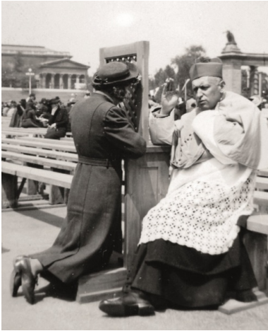
József Mindszenty spowiada podczas Kongresu Eucharystycznego w 1938 r.