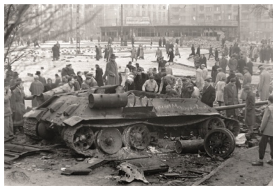
Unieruchomiony czołg sowiecki w Budapeszcie, 1956 r.

W 1951 r. na bezpośrednie polecenie sekretarza generalnego Węgierskiej Partii Pracujących Mátyása Rákosiego (właśc. Rosenfelda) wysadzono w Budapeszcie kościół Regnum Marianum. Postawiono tam później pomnik Józefa Stalina, który z kolei został zniszczony przez antykomunistycznych demonstrantów podczas powstania budapeszteńskiego w 1956 r.