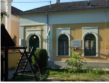
Sierociniec w Vácu, stan obecny.