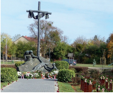
Pomnik ofiar komunistycznej masakry w Mosonmagyaróvárze w 1956 r.

Jednocześnie w Győr, stolicy powiatu, powstał nowy organ zarządzający miastem – Tymczasowa Rada Narodowa Győr pod przewodnictwem Attili Szigethyego, polityka i posła sympatyzującego z Nagyem. Wraz z powstaniem tych i podobnych nowych instytucji rewolucyjnych, w ciągu kilku dni udało się zlikwidować na prowincji sowiecki system rad i rozpocząć drogę do prawdziwej samorządności.