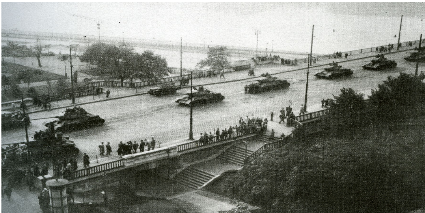
Sowieckie jednostki pancerne wkraczają do Budapesztu.

https://przystanekhistoria.pl/pa2/tematy/wegry/91660,Klerykalny-reakcjonista-Lajos-Gulyas-19181957.html