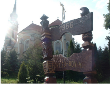
Pomnik Rewolucji 1956 w węgierskim Rönök.