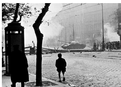
Węgry, Budapeszt, październik 1956. Sowiecki czołg usiłuje usunąć barykadę drogową w stolicy Węgier podczas antyrosyjskiego powstania Węgrów. Fot. Wikimedia Commons/domena publiczna

Demonstracja przerodziła się w rewolucję, rewolucja – w wyniku interwencji wojsk sowieckich – przerodziła się w walkę o wolność, a zaułek Corvina stał się jednym z najważniejszych i symbolicznych miejsc tej walki.