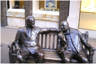
Ławeczka Franklina Delano Roosevelta i Winstona Churchilla na New Bond Street w Londynie.

Sytuacja Polski była szczególna ze względu na fakt niezakończony konflikt między rządem polskim na emigracji a stroną sowiecką w kwestiach agresji z 17 września 1939 r. Nie uregulowano problemu granicy ani odkrycia wiosną 1943 r. w Katyniu grobów polskich oficerów, zamordowanych przez NKWD w roku 1940. Wszystkie te trudne sprawy pozostały na marginesie negocjacji między mocarstwami w listopadzie 1943 r. Uznano, że granice przyszłego państwa polskiego ulegną tzw. korekcie – na wschodzie w przybliżeniu według linii Curzona, na zachodzie – kosztem Niemiec – wzdłuż Odry. Kształt przyszłego państwa polskiego był w Teheranie nieokreślony, podobnie jak przyszły ustrój i krajobraz polityczny.