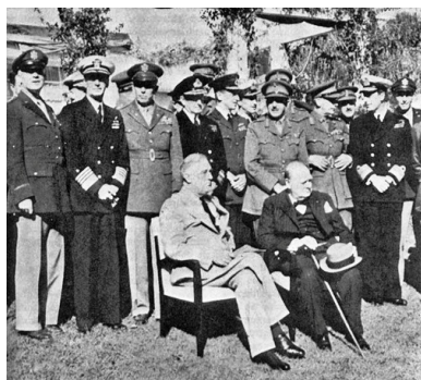
Franklin Roosevelt i Winston Churchill podczas konferencji w Casablance, styczeń 1943 r.

Szala zwycięstwa przechylała się na stronę koalicjantów, nadchodził czas ustalania nowego ładu na świecie po zakończeniu wojny. O jego kształcie i podziale stref wpływów zdecydowała Wielka Trójka: Stalin, Churchill i Roosevelt. W latach 1943-1945 spotkali się dwukrotnie w tym składzie (za trzecim razem zmarłego Roosevelta zastąpił nowy prezydent USA, Harry Truman). Ich decyzje zaważyły na losie nie tylko przegranych państw, lecz także innych, słabszych koalicjantów, takich jak Polska.