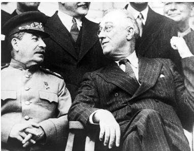
Józef Stalin i Franklin Delano Roosevelt na konferencji w Teheranie, listopad 1943 r.

Stalin, znając zamiary swoich partnerów, umiejętnie podsycił spory między Churchillem a Rooseveltem. Poważnie negocjując, kpł sobie wielokrotnie w sposób dyskretny z brytyjskiego premiera, schlebając przy tym na każdym kroku amerykańskiemu prezydentowi. Do tego stopnia zaskarbił sobie sympatię Roosevelta, że w prywatnych rozmowach po konferencji przywódca USA nazywał go „wujkiem Joe”.