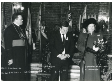
Prałat Henryk Jankowski, Lech Wałęsa i Margaret Thatcher w kościele pw. św. Brygidy w Gdańsku, 4 listopada 1988 r.

Wizyta premier Thatcher w Polsce nie przyniosła oczekiwanych przez władze PRL efektów. Rząd Wielkiej Brytanii nie wstawił się za Polską w Klubie Paryskim w sprawie jej zagranicznych długów. Wizyta dała za to nadzieję polskiej opozycji na uzyskanie poparcia Zachodu w wywieraniu nacisków na coraz bardziej osłabione władze.