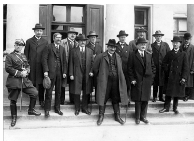
Gabinet Wincentego Witosy, 11 maja 1926 r.

Lider PSL „Piast” nie godził się na wszelkie rozstrzygnięcia za plecami Polaków. W lutym i marcu 1918 r. bardzo wyraźnie oprotestował negocjacje między państwami centralnymi a bolszewicką Rosją, a także traktat pokojowy państw centralnych z Ukraińską Republiką Ludową, w wyniku którego Ukraińcy otrzymali Chełmszczyznę i część Podlasia. Nazywał go czwartym rozbiorem Polski. 4