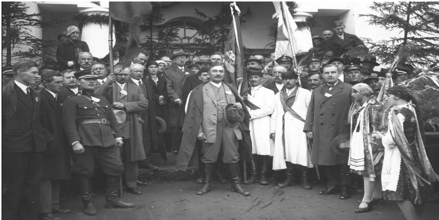
Wincenty Witos wśród uczestników uroczystości w Wierchosławicach z okazji rocznicy Bitwy Warszawskiej, 1930 r.

https://przystanekhistoria.pl/pa2/tematy/wincenty-witos/45445,Lider-ludowcow-Wincenty-Witos-18741945.htm