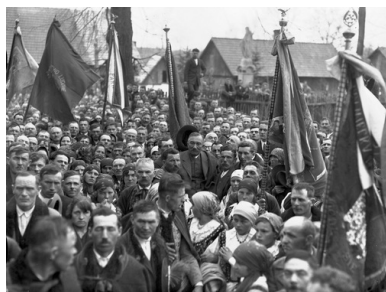
Prezes Stronnictwa Ludowego Wincenty Witos niesiony na rękach przez działaczy ruchu ludowego podczas uroczystości z okazji XXV - lecia jego działalności politycznej, 30 kwietnia 1933 r.