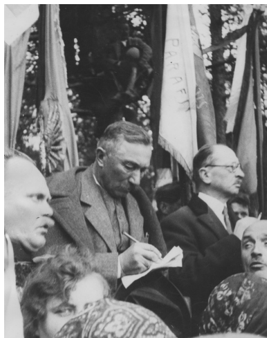
Uroczystości z okazji XXV - lecia działności politycznej Wincentego Witosa w Wierchosławicach, 30 kwietnia 1933 r.

niczyje, trzeba bronić swego, i to bronić przed każdym, kto się ośmieli po nie sięgać.” 1