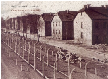
Bloki obozowe KL Auschwitz.

Pierwsza próba zrozumienia sytuacji przez Pileckiego: „Ach! Więc zamknęli nas w zakładzie dla obłąkanych!” przeradza się szybko w rzeczywistą ocenę stanu rzeczy. Każdego pytano po niemiecku, kim był w cywilu. „Odpowiedź: ksiądz, sędzia, adwokat powodowała bicie i śmierć. Przede mną w piątce stał jakiś kolega, który na to pytanie, rzucone mu z równoczesnym ujęciem go garścią za ubranie pod gardłem, odpowiedział: »Richter« [niem.: sędzia]. Fatalny pomysł! Po chwili był na ziemi bity i kopany”. Pilecki wreszcie zrozumiał: „Więc wykańczano specjalnie inteligencję. Po tym spostrzeżeniu zmieniłem nieco zdanie. To nie obłąkańcy, to jakieś potworne narzędzie do wymordowania Polaków, rozpoczynające swe dzieło od inteligencji”.