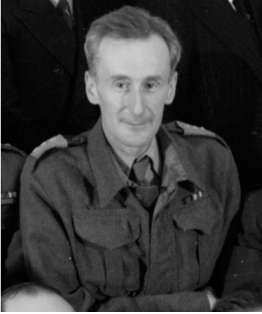
Józef Czapski (1943 r.)

G. H.-G.: Kwestia ewakuacji z ZSSR. W argumentach za, używanych między innymi przez Generała, mówi się przeważnie o względach technicznych i wojskowych: zmniejszenie racji żywnościowych, trudności z uzbrojeniem i szkoleniem, groźba rozparcelowania jednostek polskich (co, rzecz jasna, musiałyby za sobą na dalszą metę pociągnąć łatwe do przewidzenia następstwa polityczne); Anders w ostatnim swoim wywiadzie [przeprowadzonym przez Benedykta Heydenkorna] na drugi jakby plan odsuwa opory psychiczne i moralne armii więźniów, przekonany, że można je było pokonać lub przynajmniej utrzymać pod kontrolą. Argumentacja przeciw, najlepiej reprezentowana przez profesora Kota, sprowadza cały problem do ambicji personalnych Generała: