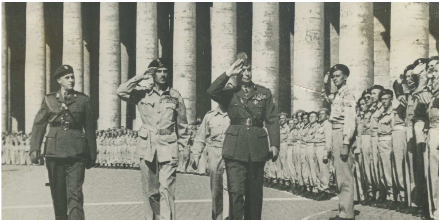
Wizyta generałów Kazimierza Sosnkowskiego i Władysława Andersa w Watykanie, 28 lipca 1944 r.

https://przystanekhistoria.pl/pa2/tematy/wladyslaw-anders/67404,Dialog-o-Dowodcy.html