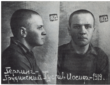
Gustaw Herling-Grudziński - zdjęcie NKWD, Grodno 1940 r.

W Bagdadzie miała zapaść ostatnia decyzja, ale Sikorski wiedział, że Anders z dowództwa całością wojsk na wschodzie nie ustąpi dobrowolnie i że nie wyrzeknie się bezpośredniego dowodzenia akcją na froncie. Sikorski wtedy ustąpił. Kto znał Andersa, wiedział dobrze, że wolę władzy miał namiętą, nie był on podwładnym wygodnym i władzy, którą posiadał, nie był gotów stracić bez walki. Wówczas, na Bliskim Wschodzie, Sikorski był już człowiekiem zmęczonym, przeżartym odpowiedzialnością za całość sprawy polskiej, przejętym pragnieniem jedności wszystkich Polaków – pod jego dowództwem naturalnie, jego przy tym odruchy próżności, prawie dziecinne, nie zyskiwały mu zwolenników. Anders był u szczytu sił, ambicji i wiedział, że na wojsko na Bliskim Wschodzie może absolutnie liczyć. W Bagdadzie Sikorski to odczuł, wola Andersa zwyciężyła. Wódz Naczelny musiał wówczas docenić sytuację i on uratował wojsko od grożącej rozgrywki. Mimo woli przypomina mi się późniejsze moje, ostatnie z nim spotkanie w Kairze, tuż przed Gibraltarem. Powiedział mi wówczas: