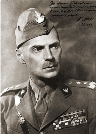
Gen. Władysław Anders

mnie wątpliwości, że u podstawy tarć, które już wówczas miały miejsce, była inna ocena sytuacji Sikorskiego i Andersa. Ten ostatni od pierwszej chwili był bardziej sceptyczny, gdy chodziło o możliwość lojalnej współpracy władz sowieckich z armią polską, ale ta nieufność dopiero po paru miesiącach wykrystalizowała u Andersa przekonanie, że stworzyć wojsko polskie bitne i zdolne do walki jest w warunkach sowieckich niemożliwe. A przecie Anders właśnie to wojsko bez broni, niedożywione, otoczone chmarą szpiclów, realizować rzetelnie próbował. Zdaje mi się, że nie doceniasz argumentu pierwszoplanowego, techniczno-wojskowego, ten argument był naturalnie nie wyłączny, ale ogromny.