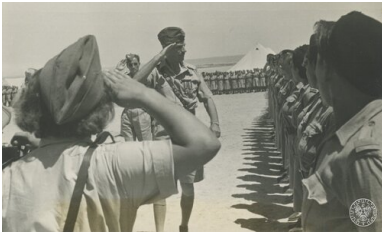
Gen. dyw. Władysław Anders (pośrodku, salutuje) przechodzi przed szeregiem ochotniczek Pomocniczej Służby Kobiet podczas przeglądu w polskim ośrodku szkoleniowym w Iraku. Na piersi generała 2 krzyże Orderu Virtuti Militari nieustalonej klasy (V i IV klasy?).