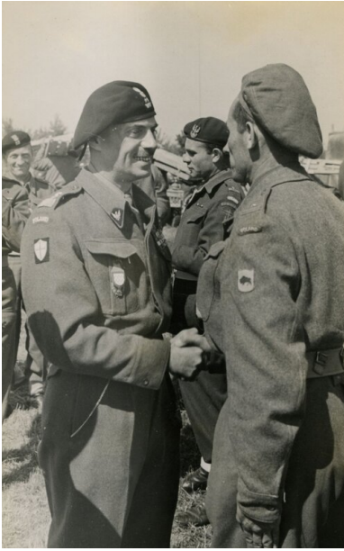
Gen. Władysław Anders z żołnierzami po zdobyciu Bolonii 1945.