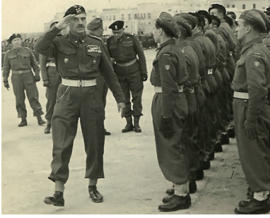
Generał Władysław Anders wśród żołnierzy 2. Korpusu Polskiego, 1945 r.

Sława i zasługi wojska nie wpłynęły na decyzje polityków. Zachodni alianci w Jałcie oddali Polskę Sowiecom (w zamian za iluzoryczne i nigdy niedotrzymane gwarancje demokratycznych rządów). Protestującemu Andersowi (wówczas już Naczelnemu Wodzowi Wojska Polskiego) brytyjski premier Winston Churchill powiedział wręcz, że może zabrać z frontu swoje dywizje, niepotrzebne już w kończącej się wojnie.