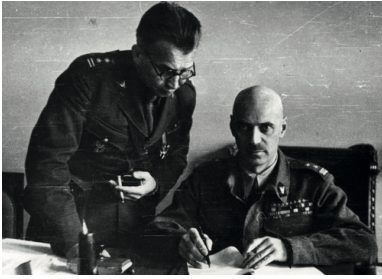
Pułkownik Leopold Okulicki i generał Władysław Anders, dowódca Armii Polskiej z ZSRS, Buzułuk, 1941 r.

Nocą z 28 na 29 września w walce z bolszewikami generał został ponownie ranny i rankiem w rejonie Sambora zatrzymany. Po rozmowie z dowodzącym na tym odcinku 12. Armią gen. Iwanem Tiuleniewem został odwieziony do lwowskiego szpitala. Tam złożono mu propozycję wstąpienia do Armii Czerwonej i współpracy przy tworzeniu kolaboracyjnego rządu polskiego. Propozycję tę powtarzano jeszcze kilkakrotnie – uniemożliwiając mu wyjazd z inwalidami do niemieckiej strefy okupacyjnej. Okazało się wówczas, że nie jest jeńcem wojennym, a traktuje się go jak szpiega i pozostaje w dyspozycji NKWD. Osadzono go w więzieniu Brygidki; 29 lutego 1940 r. został przewieziony do więzienia na moskiewskiej Łubiance. Po dwóch tygodniach względnie łagodnych przesłuchań, w lutym 1940 r. przeniesiono go na wiele miesięcy do więzienia na Butyrkach. Tam nikt go nie przesłuchiwał – torturą miało być odcięcie od wszelkich kontaktów. We wrześniu 1940 r. ponownie trafił do celi na Łubiance. Przesłuchań jednak nie kontynuowano – aż do 4 sierpnia 1941 r., kiedy to w bezpośredniej rozmowie z ludowym komisarzem spraw wewnętrznych ZSRS Ławrientijem Berią i jego zastępcą Wsiewołodem Mierkułowem usłyszał, że jest wolny.