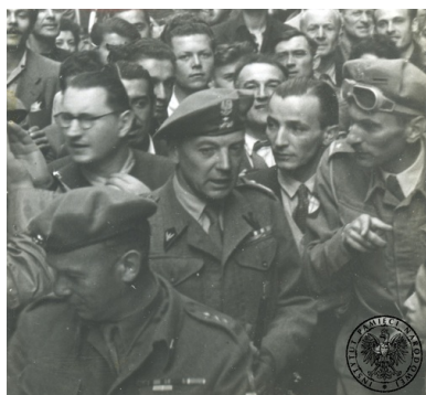
Generał Klemens Rudnicki wśród tłumu, kwiecień 1945 r.