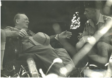
Premier Wielkiej Brytanii Winston Churchill rozmawia z gen. Władysławem Andersem podczas wizyty na stanowisku dowodzenia II. korpusu, sierpień 1944 r.