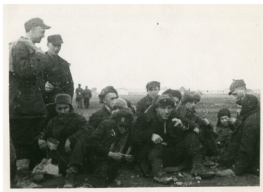
Raj - Stalina... Po "amnestji" (z odwrocia fotografii). Uwolnieni z łagrów sowieckich po przybyciu do Armii gen. Andersa, grudzień 1941 r.