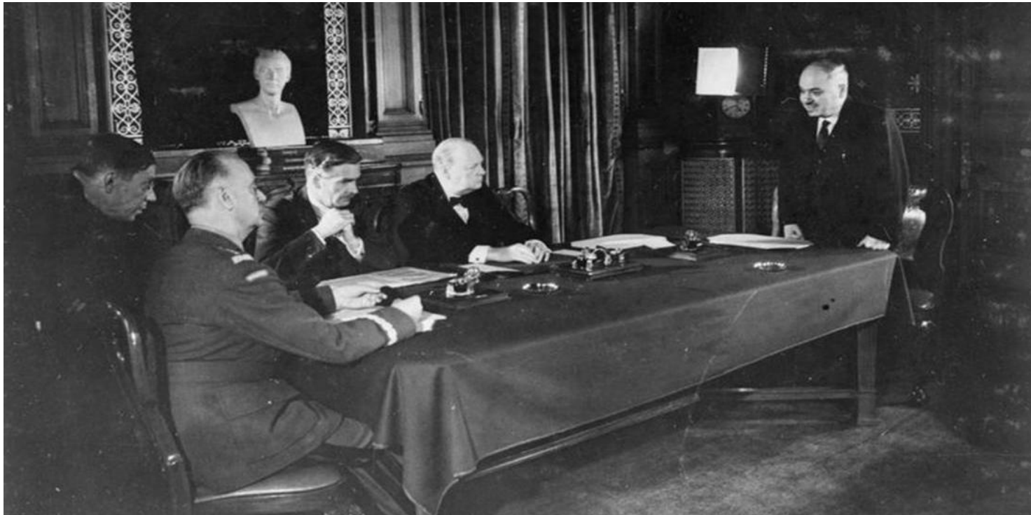
Podpisanie układu Sikorski-Majski

https://przystanekhistoria.pl/pa2/tematy/wladyslaw-sikorski/76526,Uklad-Sikorski-Majski-Nie-byla-to-scena-z-Matejki.html