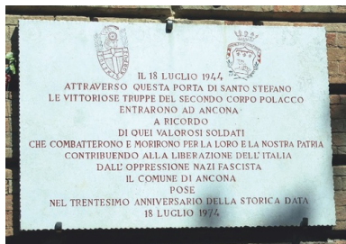
Tablica upamiętniająca wejście do Ankony oddziałów 2. Korpusu Polskiego 18 lipca 1944 r.

2. Korpus Polski podszedł pod Ankonę w trakcie działań pościgowych prowadzonych wzdłuż Adriatyku od połowy czerwca do połowy lipca 1944 r. Dzięki manewrowi oskrzydłającemu 5. Kresowej Dywizji Piechoty, po dwudniowych walkach, 18 lipca 1944 r., do miasta wkroczyli żołnierze 3. Pułku Ułanów Karpackich i 2. Batalionu Strzelców Karpackich. Przełamanie niemieckich pozycji nastąpiło na osi dziewiętnastowiecznej bramy fortecznej Porta Santo Stefano, która obecnie jest miejscem upamiętniającym zwycięstwo polskich żołnierzy. Polegli w walkach w rejonie Ankony spoczywają na polskim cmentarzu wojennym w Loreto. Po wyzwoleniu Ankony ulica prowadząca od bramy św. Stefana otrzymała nazwę Pułku Ułanów Karpackich. Obecnie jest to plac 2. Korpusu Polskiego. Na zewnętrznej stronie bramy zawieszono tablicę upamiętniającą wkroczenie Polaków do miasta.