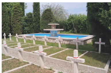
Polski Cmentarz Wojenny w Bolonii; spoczywa na nim 1432 polskich żołnierzy

Położony w dzielnicy San Lazzaro di Savena – niegdyś miejscowości pod Bolonią – jest największym z czterech cmentarzy 2. Korpusu Polskiego we Włoszech. Spoczywają tu żołnierze polscy polegli w walkach na Linii Gotów, w Apeninie Emiliańskim i w bitwie o Bolonię. Działania, których efektem było zajęcie Bolonii, rozpoczęły się jeszcze jesienią 1944 r. Jednostki 2. Korpusu Polskiego prowadziły natarcie w ogólnym kierunku na Bolonię wzdłuż starożytnej drogi Via Emilia. Walki toczono w bardzo niekorzystnych warunkach terenowych i klimatycznych. Liczne górskie rzeki i strumienie płynęły prostopadle do kierunku natarcia, spowalniając postępy wojsk alianckich. Ostatecznie w połowie grudnia 1944 r. wstrzymano działania na sezon zimowy, przechodząc do obrony na linii rzeki Senio. Natarcie na Bolonię ponownie ruszyło w kwietniu 1945 r. Decyzją gen. Richarda McCreery’ego, dowódcy 8. Armii, 2. Korpus Polski został wzmocniony przez jednostki brytyjskie. Zasadniczy manewr oskrzydający i działania pościgowe prowadziło zgrupowanie „RAK”, dowodzone przez gen. Bronisława Rakowskiego. Jednak to operujące na kierunku pomocniczym zgrupowanie „RUD” świeżo awansowanego (1 kwietnia) na pierwszy stopień generalski Klemensa Rudnickiego osiągnęło roгатki Bolonii. 21 kwietnia o 6.00 rano do centrum miasta wkroczyli żołnierze 9. Batalionu Strzelców Karpackich mjr. Józefa Różańskiego, zdobywając dla swojej jednostki zaszczytne imię „Boloński”.