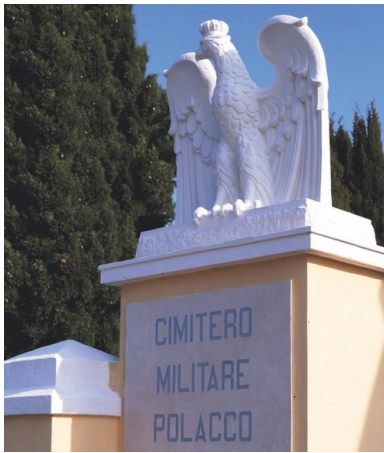
Orzeł strzegący polskich grobów na Polskim Cmentarzu Wojennym w Casamassimie