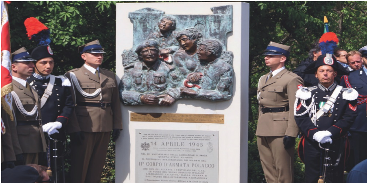
Tablica upamiętniająca wyzwolenie Imoli przez 2. Korpus Polski

https://przystanekhistoria.pl/pa2/tematy/wlochy/87313,Nie-tylko-Monte-Cassino-Polskie-miejsca-pamieci-we-Wloszech.html