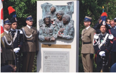
Tablica upamiętniająca wyzwolenie Imoli przez 2. Korpus Polski

Miejscowość została wyzwolona 17 kwietnia 1945 r. przez zgrupowanie „RUD” gen. Klemensa Rudnickiego w ramach wznowionej ofensywy na Bolonię. W siedemdziesiątą rocznicę tego wydarzenia miejscowe władze odsłoniły nad brzegiem rzeki Sillaro niewielki pomnik z terakotową płaskorzeźbą przedstawiającą walki polskich żołnierzy o miasto.