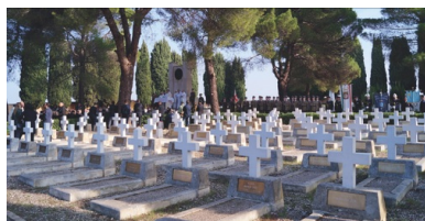
Polski Cmentarz Wojenny w Casamassimie

Jak na każdym polskim cmentarzu wojennym we Włoszech, wśród dominujących grobów katolików znajdujemy mogiły żołnierzy prawosławnych, wyznania mojżeszowego oraz muzułmanów. Pochówki na cmentarzu odbywały się do momentu ewakuacji 2. Korpusu Polskiego do Wielkiej Brytanii w 1946 r. Z pewnością najbardziej rozpoznawalną postacią pochowaną w Casamassimie był mjr Henryk Sucharski, we wrześniu 1939 r. komendant Wojskowej Składnicy Tranzytowej na Westerplatte. Przebywał w niewoli niemieckiej do końca wojny. W lipcu 1945 r. zameldował się w dowództwie 2. Korpusu Polskiego we Włoszech, w styczniu następnego roku otrzymał stanowisko dowódcy 6. Batalionu Strzelców Karpackich. Zmarł 30 sierpnia 1946 r. w brytyjskim szpitalu wojskowym w Neapolu w wyniku zapalenia otrzewnej. Szczątki majora ekshumowano 21 sierpnia 1971 r. i przewieziono do Polski, a 1 września tegoż roku pochowano na cmentarzu wojennym na Westerplatte.