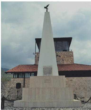
Pomnik 6. Pułku Pancernego „Dzieci Lwowskich” w Piedimonte