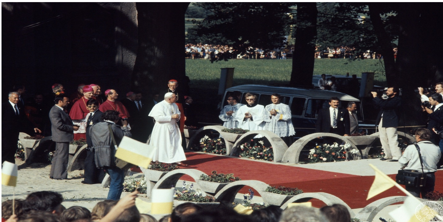
Jan Paweł II przed rozpoczęciem nieszpórów maryjnych na Górze Świętej Anny, 21 VI 1983 r.

https://przystanekhistoria.pl/pa2/tematy/wojciech-jaruzelski/102445,Przywrocenie-nadziei.html