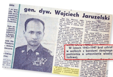
» Z teczki Jaruzelskiego usuwano informacje, która w czasach PRL, powielano publicznie w milionach egzemplarzy na zdjęciu „Złotych Wołnowca” z kwietnia 1953 roku

Równie ważna jak moment przerabiania dokumentu jest treść kolejnych poprawek. Otóż z innych źródeł wiadomo, że Jaruzelski na Syberii półtora roku pracował przy wyrębie drzewa w tajdze, a potem przez pół roku w przedsiębiorstwie handlowym. Ale w wyciągu z akt Jaruzelski skreślił tę drugą informację. To koresponduje z zamazaniami dokonanymi czarnym pisakiem w dokumencie z 1955 roku. Ekspertyza zamazanego tekstu przeprowadzona w lutym 2014 roku pozwoliła na jego odczytanie: tu też zamazano pracę w handlu.