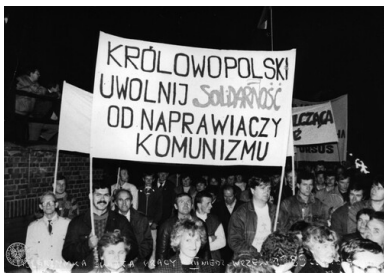
Uczestnicy Pielgrzymki Świata Pracy do Częstochowy we wrześniu 1989 r. niosą transparent o treści: Królowo Polski/ uwolnij Solidarność/ od naprawiaczy/ komunizmu .