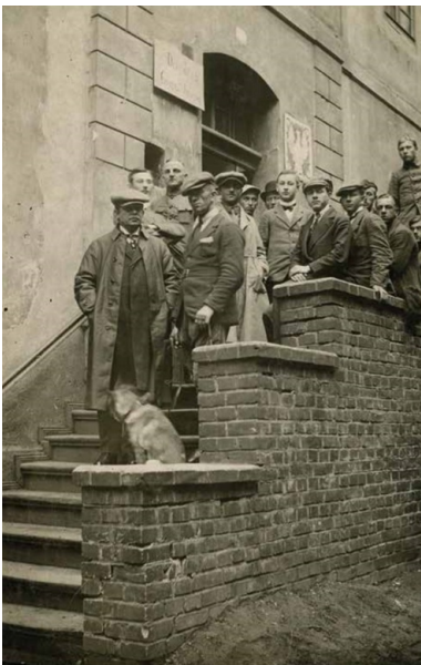
Wojciech Korfanty przed siedzibą dowództwa Grupy „Północ” wojsk powstańczych w Tworogu w

3 maja Korfanty ogłosił się dyktatorem powstania, następnego dnia powstała Naczelna Władza na Górnym Śląsku, złożona z reprezentantów wszystkich polskich partii i stronnictw politycznych – rodzaj powstańczego rządu. Od dwóch dni toczyły się już walki, które koordynowała Naczelna Komenda Wojsk Powstańczych z Maciejem Mielżyńskim na czele.