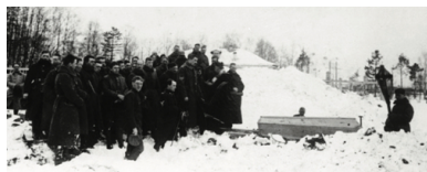
Pogrzeb polskiego żołnierza z oddziału murmańczyków.

Tekst pochodzi z numeru 12/2018 „Biuletynu IPN”