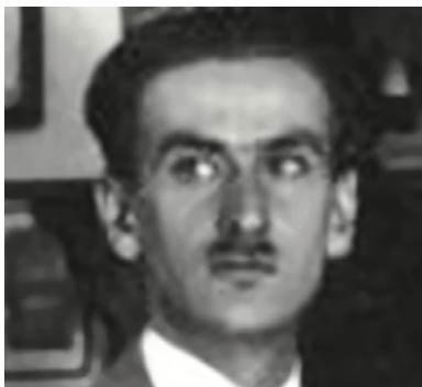
Józef Mackiewicz

Aliancka międzynarodówka po opanowaniu okolic Murmańska i zepchnięciu bolszewików na dalsze tereny zajęła się raczej własnym życiem, przetrwaniem w trudnych warunkach podbiegunowej Północy. Żołnierze różnych nacji musieli zbudować siedziby i fortyfikacje, magazyny, składy i drogi do przerzutowego portu w Archangielsku. Wielu polskich żołnierzy zastanawiało się podczas przedłużającej się kampanii murmańskiej, czy jest to jeszcze walka o Polskę, czy przyczynia się do zdobycia wolności, czy ma patriotyczny sens w chaosie wojennym, który trwał już od 1914 r. W opowiadaniu Blokhauz pod Syreną polscy żołnierze – rzućni na daleką od kraju, obcą Północ – doczekują jednak wzruszającego przełomu. Po szybkim zbudowaniu, ku zazdrości sąsiadów, swojej siedziby przygotowują się do Wigilii 1918 r., nie mając jeszcze żadnych wiadomości z kraju. Dopiero w wieczór wigilijny spotyka ich największa dla wszystkich niespodzianka. Polski komendant nie mógł ukryć wzruszenia, podając oczekiwaną przez wszystkich wiadomość: