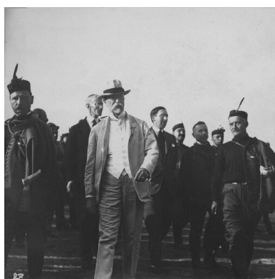
Prezydent Czechosłowacji Tomáš Masaryk na zjeździe Sokolstwa w 1920 r.

Władze I Republiki liczyły się z upadkiem Polski, o czym świadczy opracowanie tzw. planu „B” (bolszewicy) zakładającego obsadzenie granicy z Polską wojskiem i konieczność przyjęcia fali polskich uchodźców, którzy mieli być rozsielani na terytorium ČSR. Rząd Republiki tolerował manifestacje poparcia dla bolszewików, które miały miejsce zwłaszcza 19 sierpnia 1920 r.