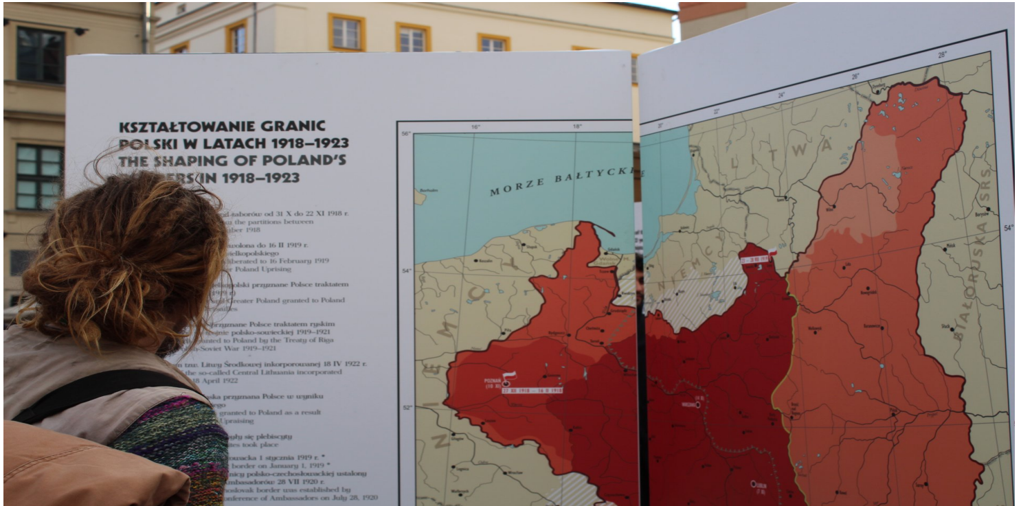
Plansza z wystawy IPN „Ojcowie Niepodległości”

https://przystanekhistoria.pl/pa2/tematy/wojna-polsko-bolszewick/72024,Wojna-polsko-bolszewicka-1920-roku.html