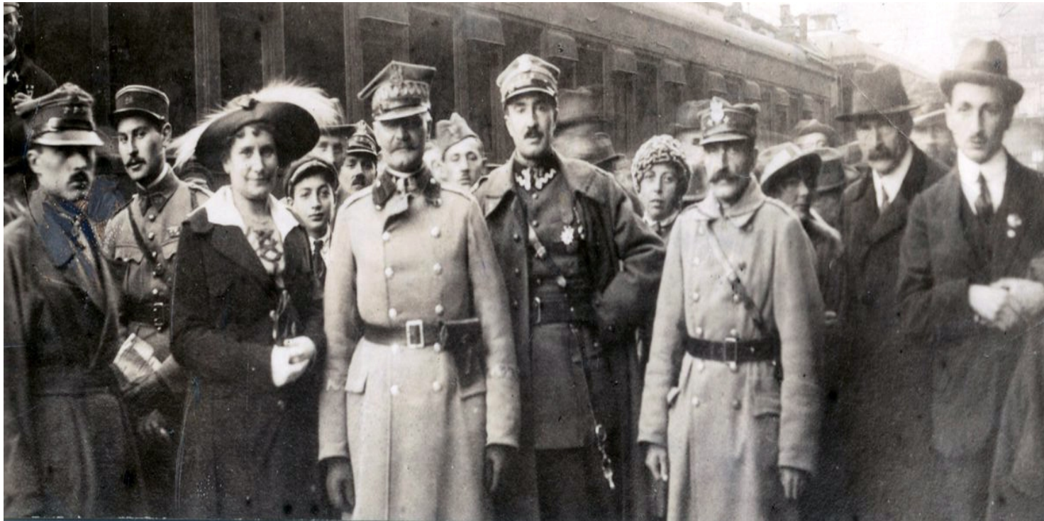
Delegacja polska na rokowania ryskie, w środku gen. Mieczysław Kuliński

https://przystanekhistoria.pl/pa2/tematy/wojna-polsko-bolszewick/76154,Traktat-ktory-nie-zadowalal-zadnej-ze-stron.html