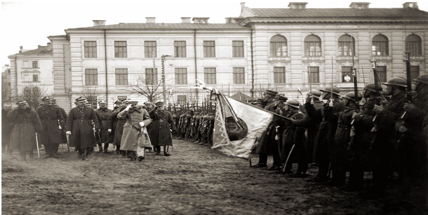
Wilno, Plac Łukiski, 19 kwietnia 1919. Przegląd oddziałów Wojska Polskiego po zajęciu miasta

https://przystanekhistoria.pl/pa2/tematy/wojna-polsko-bolszewick/87479,Pierwsza-agresja-geneza-i-początek-wojny-z-bolszewikami.html