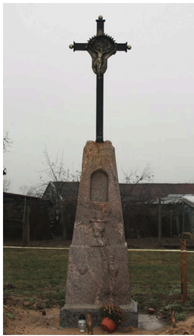
Krzyż przydrożny z 1899 r. w Mątwicy

Żołnierze zostali pochowani 14 sierpnia 2019 r. na cmentarzu parafialnym w Łomży w mogile zbiorowej ze swoimi towarzyszami.