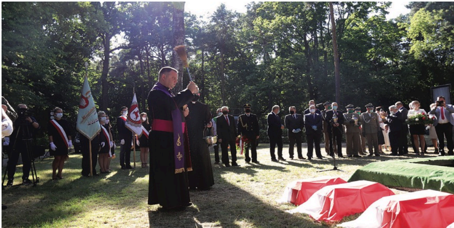
Pogrzeb żołnierzy poległych w 1920 r., w bitwie pod Brodnicą

https://przystanekhistoria.pl/pa2/tematy/wojna-polsko-bolszewick/94403,Ekshumacje-zolnierzy-Armii-Ochotniczej-i-upamietnienie-jej-bohaterow.html