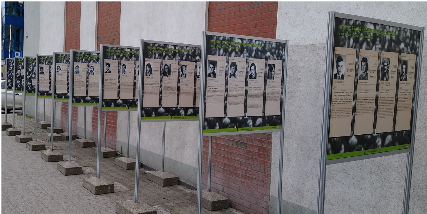
Wystawa IPN „W walce o lepszą przyszłość. Wolne Związki Zawodowe 1978-1980”

https://przystanekhistoria.pl/pa2/tematy/wolne-zwiazki-zawodowe/66516,WZZ-Wybrzeza-czyli-ludzie-musza-sie-bronic.html