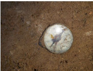
Kompas znaleziony w grobie pod murem cmentarza w kwietniu 2019 r.

W grobie znaleziono tylko jeden szkielet ludzki, jednak wielkość i kształt jamy grobowej oraz niektóre znalezione przedmioty (dwa grzebienie, dwa niezbędniki) wskazywały, że pierwotnie było tam pogrzebanych więcej osób. Szkielet spoczywał na dnie stosunkowo płytkiej jamy - na głębokości 1,31 m - na plecach, z głową zwróconą ku zachodowi. Ułożony był w pozycji anatomicznej, jednak z kilkoma zaburzeniami - brakowało obu podudzi, a obie kości udowe nosiły ślady ukośnych cięć. Można zatem podejrzewać, że obrażenia te powstały podczas pospiesznej ekshumacji w październiku 1939 r., a zadano je szpadlem. W ten sam sposób można również tłumaczyć brak lewego przedramienia i ślad analogicznego cięcia na lewej kości ramiennej.