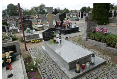
Grób na cmentarzu w Starym Ochędzynie, w którym spoczywają dwaj żołnierze polegli 2 września 1939 r. na polach w Nowym Ochędzynie