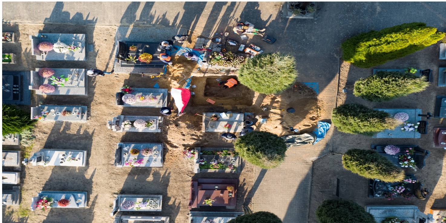
Prace w grobie wojennym na cmentarzu w Starym Ochędzynie, listopad 2020 r.

https://przystanekhistoria.pl/pa2/tematy/wrzesien-1939/103140,Polegli-w-obronie-granicy-o-zolnierzach-Wieluńskich-Batalionow-Obrony-Narodowej.html