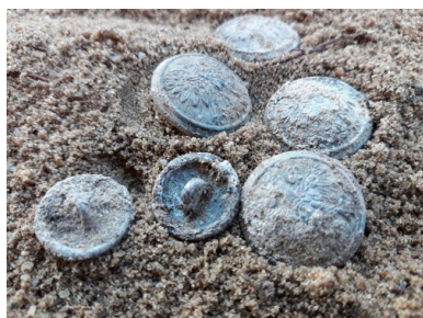
Guziki od munduru znalezione podczas prac ekshumacyjnych

W listopadzie 2020 r. zespół IPN wrócił na cmentarz w Starym Ochędzynie, aby przeprowadzić badania w obrębie grobu, w którym miano pochować dwóch pozostałych żołnierzy. W trakcie prac odkryto szkielety dwóch mężczyzn – wielkość jamy grobowej wskazywała, że była ona wykopana z myślą o pochowaniu tam trzech osób. Spoczywały one w układzie anatomicznym, na plecach, z wyprostowanymi nogami. Na jednym ze szkieletów w rejonie klatki piersiowej i czaszki (także w jej wnętrzu) znajdowały się metalowe guziki wojskowe