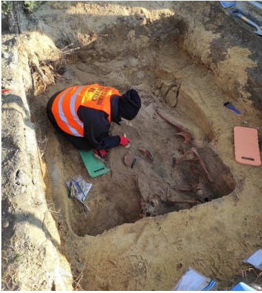
Prace ekshumacyjne w obrębie grobu wojennego, listopad 2020 r.