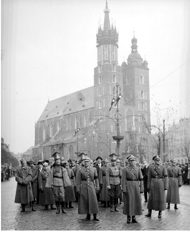
Stanisław Grzmot-Skotnicki na czele konduktu pogrzebowego Władysława Beliny- Prażmowskiego.