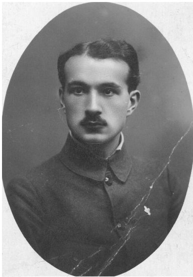
Kazimierz Kierkowski w okresie Wielkiej Wojny