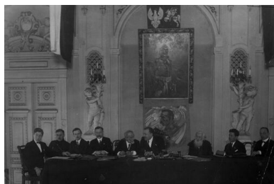
Zjazd Związku Strzeleckiego w Warszawie, 1925 r.

Krakowie i stąd dowodzić dywersją pozafrontową.